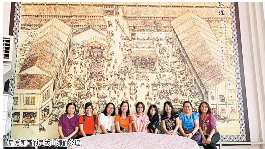
后方所画的是大山脚伯公埕。