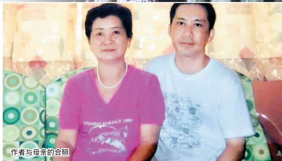
作者与母亲的合照